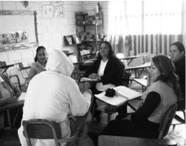
Promotoras Voluntarias de Derechos Humanos del Fraccionamiento los Ángeles

Asimismo, el 12 de febrero se impartió en la “Escuela Guadalupe Victoria” de Fomerrey 24 una capacitación a 20 Promotoras Voluntarias de Derechos Humanos. Mediante dicha capacitación se pretende abarcar una mayor población en el Estado para enseñar a las niñas y niños a decir NO al cariño malo y que establezcan un compromiso personal para cuidar su cuerpo.