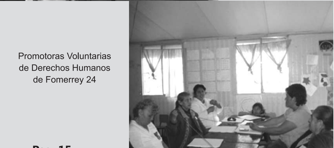
Promotoras Voluntarias de Derechos Humanos de Fomerrey 24