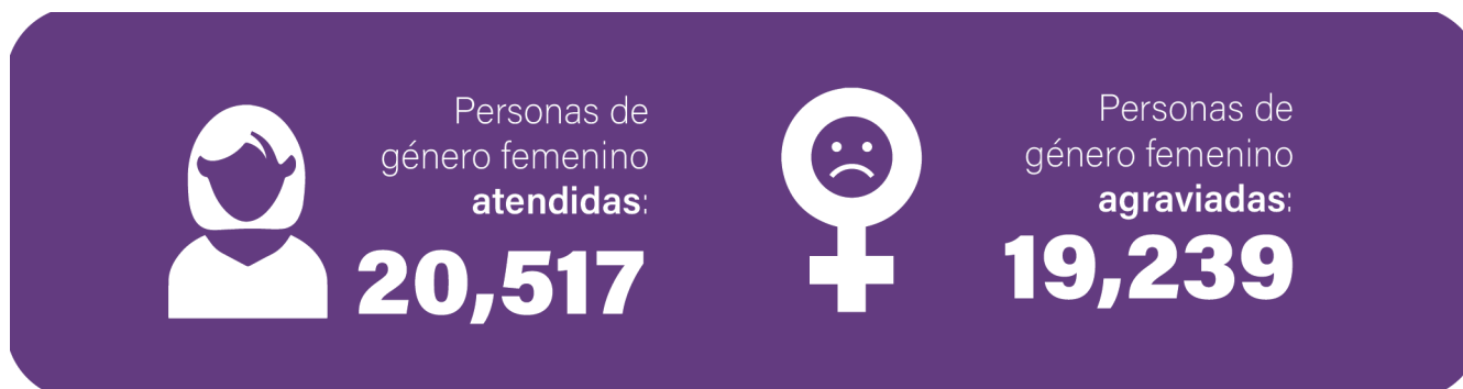
Figura 1. Personas de género femenino atendidas y agraviadas

Como se aprecia a continuación, si bien los años 2020 y 2021 estuvieron marcados por la pandemia de la COVID-19, se puede estimar un aumento significativo año tras año, y un incremento por encima del 77% respecto a la primera y a la última anualidad del reporte.